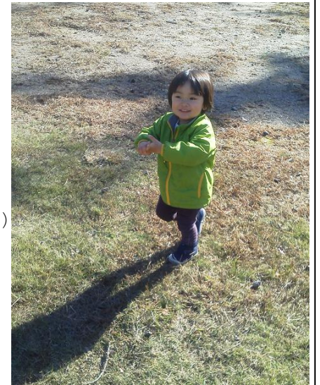
↑ 歌詞にも出てくる 秋葉山で熱唱中(笑)