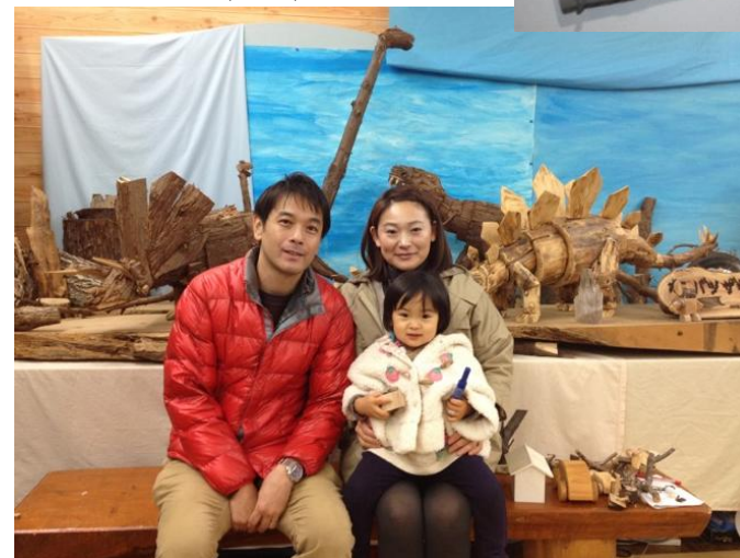
↑ 木工細工たちと家族写真♪

↑ 楽しく作った木工細工 「桃ママがほぼひとり」 「も・も・は」と焼印のフリーストです