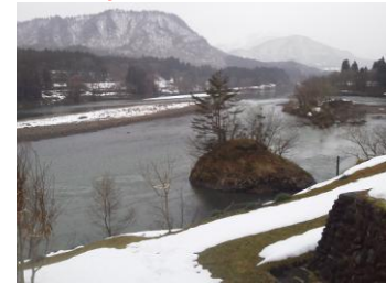
↑ 古澤屋さんからの景色