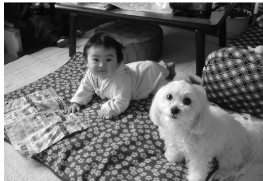
いつも微妙な距離感の愛娘と愛犬♪

そんな愛娘はこの4月から4ヶ月通った金津保育園から愛慈保育園へと移りました。皆様のお子様、お孫様等々、愛慈保育園へ通っている方が居りましたら、今後とも、どうぞよろしくお願ひします m(_ _)m